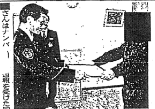
東名バスの運転手による飲酒運転を通報し、野中隊長から感謝状を受け取る〇〇さん(右)＝静岡市中島の東警高速隊

JRバス関東の東名 高速バス運転手の飲酒 運転事件で、迅速な通 報が事故を未然に防 いだとして、県警高速隊 (警) 〇〇に感謝状を贈 った。〇〇は八月十八 日、桜井岡本の東名 高速バスで、下り線に 〇〇の